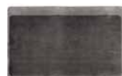
11 DIBBETS CAMBRÉ TEPPICH CM 600X300