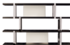
10 DALTON "CHROME" BÜCHERREGAL CM 240X40 H148